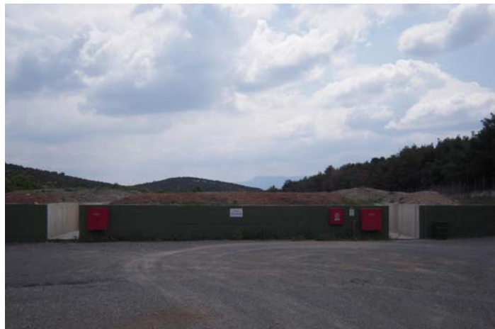
Πεδίο δοκιμών της EXTRACO

Στο πεδίο δοκιμών, πραγματοποιούνται οι πειραματικές δοκιμές δια εκρήξεως καθώς και η καταστροφή των ακατάλληλων προς χρήση υλικών.