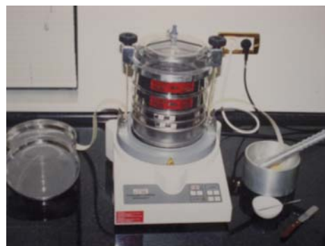
Συσκευή κοκκομετρικής ανάλυσης