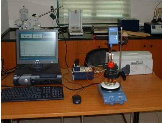
Συσκευή μέτρησης σημείου πήξεως του TNT