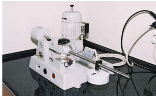
Συσκευή μέτρησης ευαισθησίας σε τριβή και κρούση