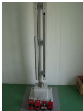
Όργανο μέτρησης ευαισθησίας σε κρούση