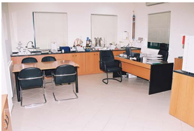
Εργαστήριο ποιοτικού ελέγχου της EXTRACO

Το εργαστήριο ποιοτικού ελέγχου της EXTRACO είναι εξοπλισμένο με τον αριότερο εργαστηριακό και λοιπό εξοπλισμό ενώ είναι εφοδιασμένο με την απαραίτητη ελληνική και διεθνή επιστημονική βιβλιογραφία σχετικά με τα εκρηκτικά. Το εξειδικευμένο και άρτια εκπαιδευμένο προσωπικό του εργαστηρίου ακολουθεί πολύ συγκεκριμένες διαδικασίες έλεγχου όλων των προϊόντων. Οι αναλύσεις και οι δοκιμές που πραγματοποιούνται στις εγκαταστάσεις της Τανάγρας αφορούν τόσο τις εκρηκτικές ύλες που εισάγει και που παράγει η εταιρία όσο και τις πρώτες ύλες που χρησιμοποιούνται στην παραγωγή.